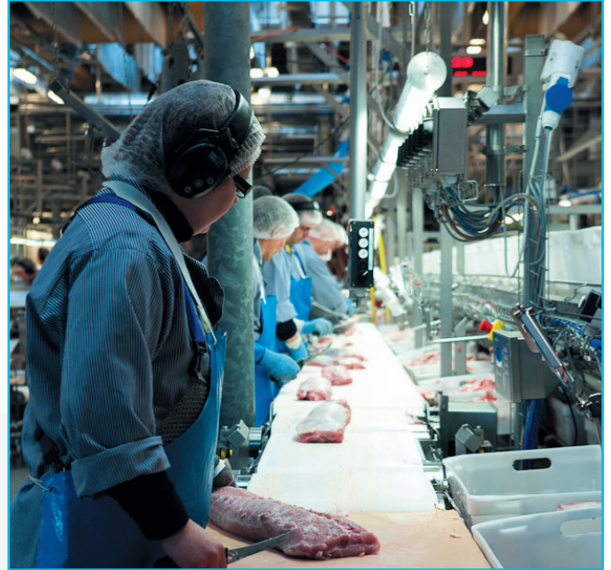
Línea de deshuese en movimiento para lomos

Los datos técnicos están sujetos a modificaciones.