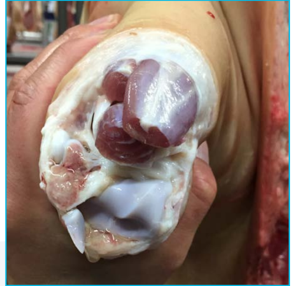
Resultado del corte de la pezuña delantera

Los datos técnicos están sujetos a modificaciones.